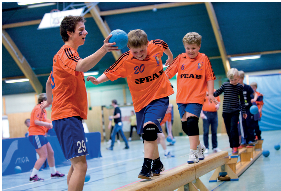
Att vara aktivitetsledare är både kul och lärorikt.

I alla föreningar råder demokrati och det innebär att alla ska få vara med och bestämma. Men hur fungerar demokratin om det nästan